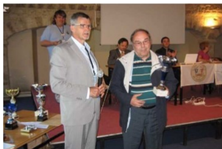
F5IN premier au concours EUCW

Pendant ce temps, d'autres assistaient à des projections d'expéditions dont TS7C et participaient à un concours de pile up histoire de ne pas perdre la main.