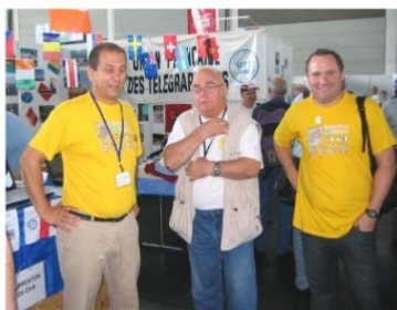
EA7AJR – F5NQL – EA5RM