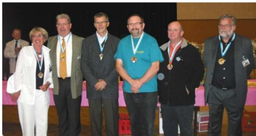
Micheline (XYL F9IE), F5AHO, F6AXX, F8IXZ, F6BLP, F5LGE