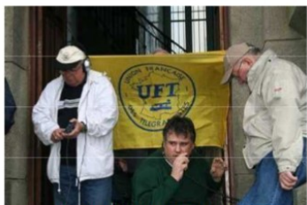
F8UFT/P EU 105 CW/SSB

Pour la première fois depuis sa création, c'est la Bretagne qui a accueilli les membres de l'UFT pour l'Assemblée générale annuelle de l'association les 28 et 29 avril 2007.