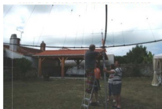
TM7C : Montage de la Spiderbeam