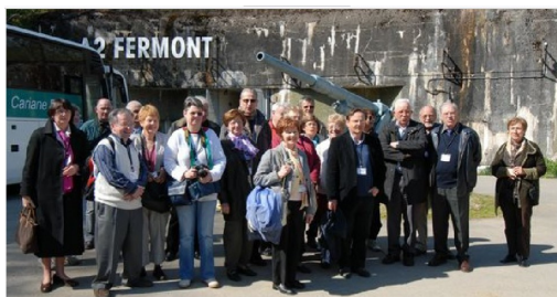
Visite du fort de Fermont

L'Assemblée générale 2008, organisée par le radio-club de l'ARAS 54 F6KWP, s'est tenue à Hussigny-Godbrange près de Longwy en Meurthe-et-Moselle les 2 et 3 mai 2008.