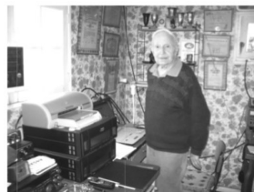
Le REF-UNION distingue l'un de nos membres les plus prestigieux.