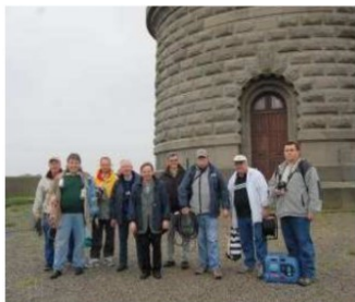
Les opérateurs et les « petites mains »

Une centaine de QSO a été réalisée malgré des conditions de trafic et une installation assez acrobatiques.