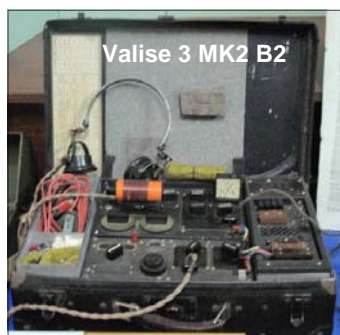
Valise 3 MK2 B2